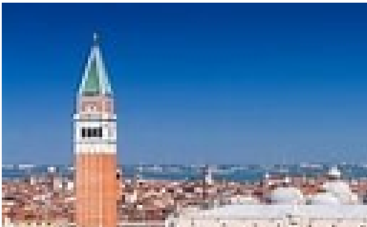
(Panorama di Piazza San Marco)