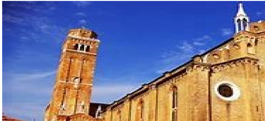
(Basilica dei Frari)